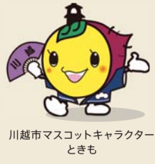
川越市マスコットキャラクターとき

それぞれのエリアはどれも魅力的。 巡回バスなどを使うと効率的にスポット巡りが楽しめます。